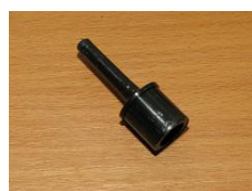
GROT DO RUREK