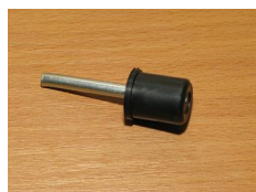
KOREK ZE SZPILĄ