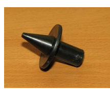
STOPKA Z GROTEM