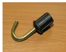
ZACZEP HAK DO PRZYCZEPY