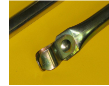
ZACISK DO RUR

Wykonujemy usługi w zakresie naprawy konstrukcji stelaży do namiotów i przedsionków wg dokumentacji technicznej. Prowadzimy sprzedaż elementów stelaży na uzupełnienia do sklepów i hurtowni sprzętu turystyczno-sportowego, firm dilerkich oraz firm naprawiających namioty na terenie całego kraju.